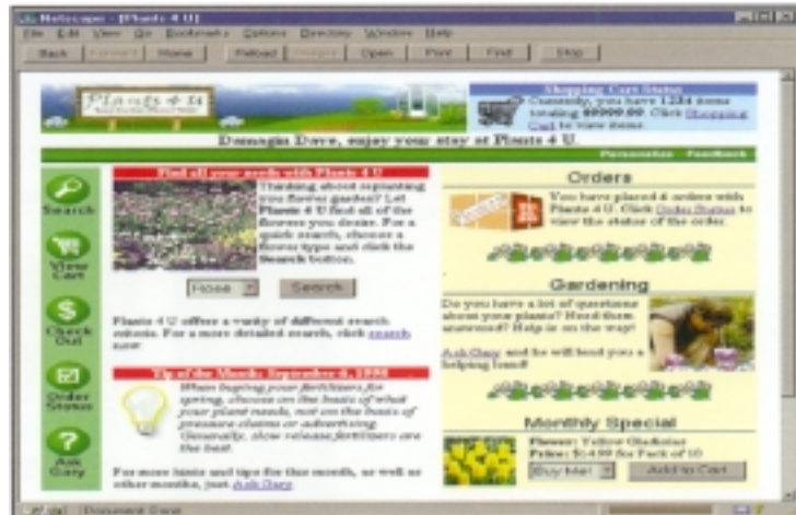
LANSa le permite crear fácilmente aplicaciones avanzadas para Internet.

Con LANSa puede crear fácil y rápidamente consultas dinámicas y aplicaciones comerciales que accedan en forma segura a sus datos en AS/400.